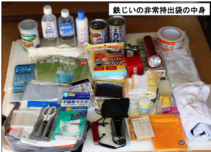
鉄じいの非常持出袋の中身

出来合い製品も良いが、ここは一つ自分用の非常持出袋を作ってもらいたいものじゃ。下にわしの非常持出袋を紹介しよう。皆さんには次のページのリストを見て、よく考えて揃えてほしい。もちろん一人一袋じゃ。考えて作ることで自分が災害対策に大変役立つぞ。