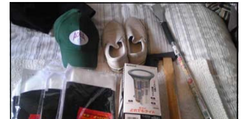
鉄じいの部屋には、懐中電灯、バール、なた、靴などがある

わしは、まあ数日間山歩きでもするつもりで作ったのじゃ。そして、寝ても起きても携帯電話は常に身につけておくようにしている。また枕元には必ず財布(大銭小銭・カード類・健康保険証など)と懐中電灯を置いておく。また寝室には、靴やバールやハンマーや厚手の帽子なども用意してある。閉じ込められてはかなわんからな。そして何よりも非常持出袋はフックから下げておくことじゃな。